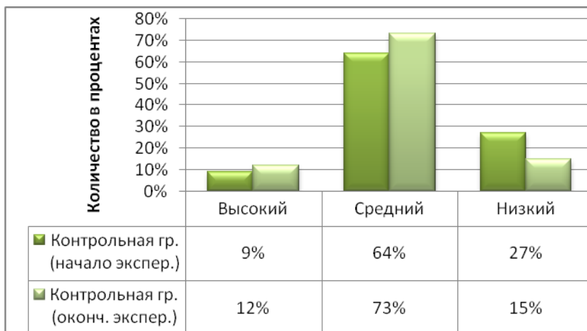
Рис. 5. Диаграмма, отражающая динамику количества участников контрольной группы в соответствии с уровнями сформированности военно-патриотических качеств (данные контрольного эксперимента)

у молодежи гордости за Отечество, его свершения, на воспитание уважения к истории страны; на формирование мотивации и готовности к достойному и самоотверженному служению обществу и государству, к выполнению обязанностей по защите Отечества; на совершение действий, отвечающих государственным и общественным интересам, оказалась достаточно эффективной, что полностью подтвердило правомерность выдвинутой нами ранее гипотезы исследования.