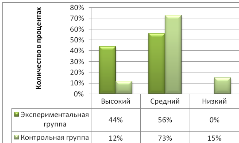
Рис. 4. Сравнительная диаграмма, отражающая количество участников экспериментальной и контрольной групп в соответствии с уровнями сформированности военно-патриотических качеств (данные контрольного эксперимента)

Кроме того, мы сравнили данные, полученные в экспериментальной и контрольной группах на момент окончания эксперимента (рисунок 4).