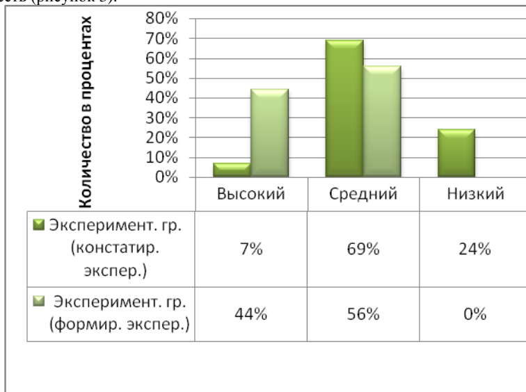
Рис. 3. Сравнительная диаграмма, отражающая динамику

Проведенный нами контрольный эксперимент заключался в сравнении данных, полученных на контрольном и формирующем этапах экспериментальной работы. Результаты сравнительного анализа показали, что у молодых людей, принимающих участие в формирующем эксперименте, наблюдается четкая положительная динамика в отношении сформированности военно-патриотических качеств (рисунок 3).