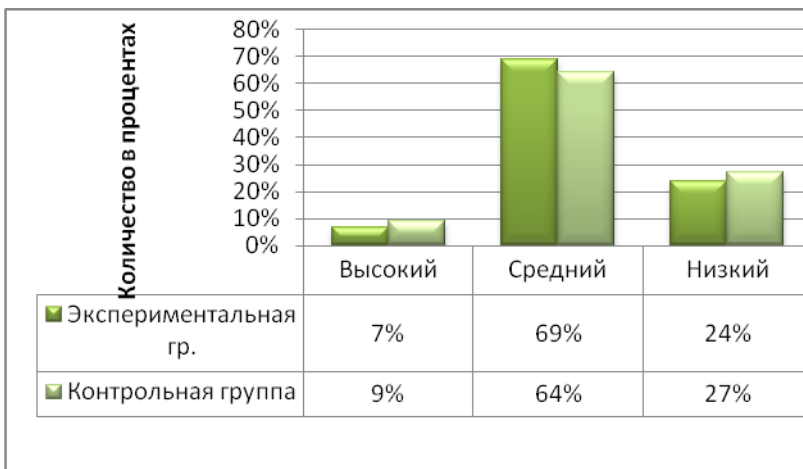
Рис. 2. Сравнительная диаграмма, отражающая количество участников экспериментальной и контрольной групп в соответствии с уровнями сформированности военно-патриотических качеств (данные констатирующего эксперимента)

Формирующий этап экспериментальной работы, направленный на апробирование разработанной модели, проходил с 2013 по 2014 гг., участниками которого являлись 86 человек – студентов 1-2 курсов Орловского государственного института искусств и культуры, составившие экспериментальную группу, и 7 человек – педагогов-организаторов социально-культурной деятельности с молодыми людьми. С молодыми людьми, вошедшими в контрольную группу, педагогическая работа в соответствии с разработанной нами моделью, не проводилась.