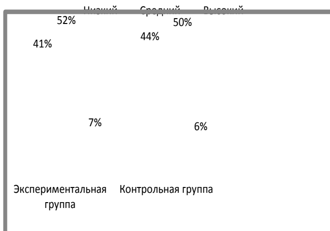
Рисунок 2. Сравнительная диаграмма условного распределения подростков экспериментальной и контрольной групп в соответствии с выявленными уровнями этнокультурной социализации (на констатирующем этапе эксперимента)

Исходя из предмета и задач исследования, выстраивались этапы формирующего эксперимента .