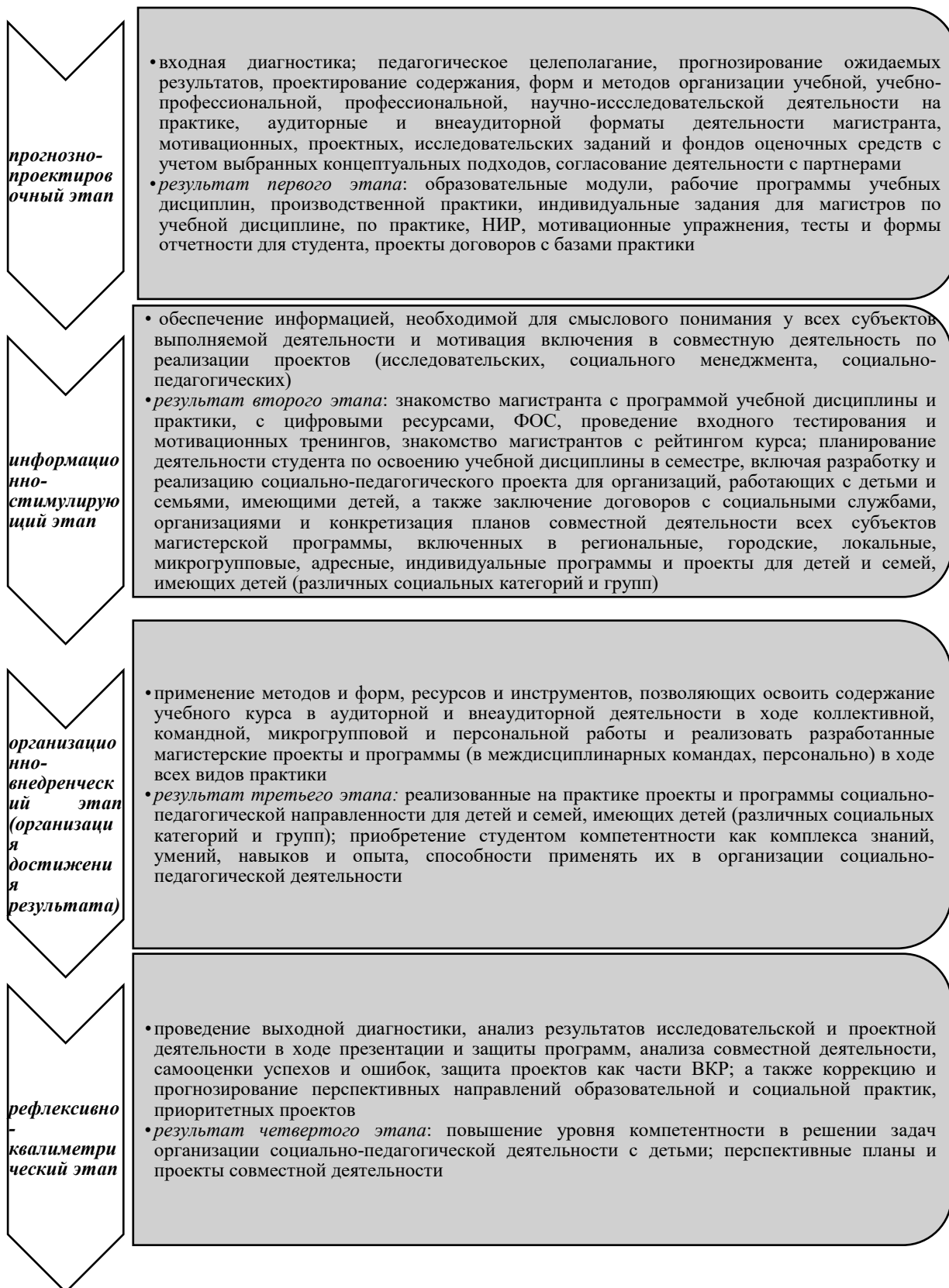
Рисунок 2. Этапы технологии подготовки магистрантов социальной направленности к организации социально-педагогической деятельности с детьми

Разработанная технология является педагогической технологией, которая описывает и интегрирует результаты системы действий по педагогическому