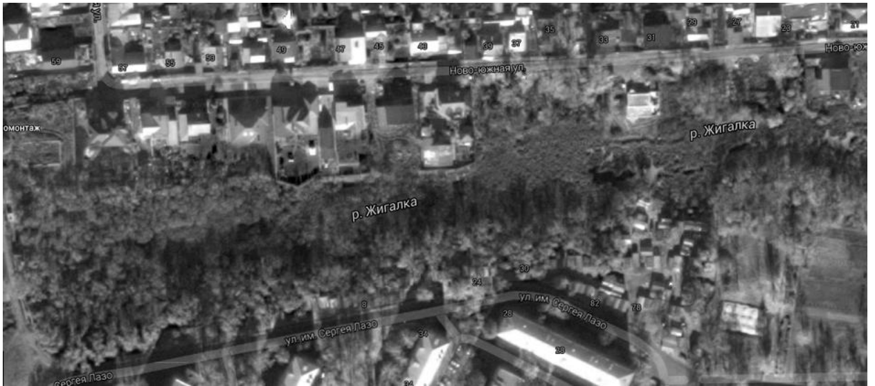
Рис. 4. «Дикие» заросли в русле речки Жигалки в южной части Тамбова.

Космоснимки подтвердили давнее лидерство Пензы в сравнении с соседними областными городами по показателю озеленения. На снимках виден только один квартал из 715, где нет зелени. В Рязани таких кварталов оказалось 230 из 415 (55%), в Тамбове – 58 из 253 (23%).