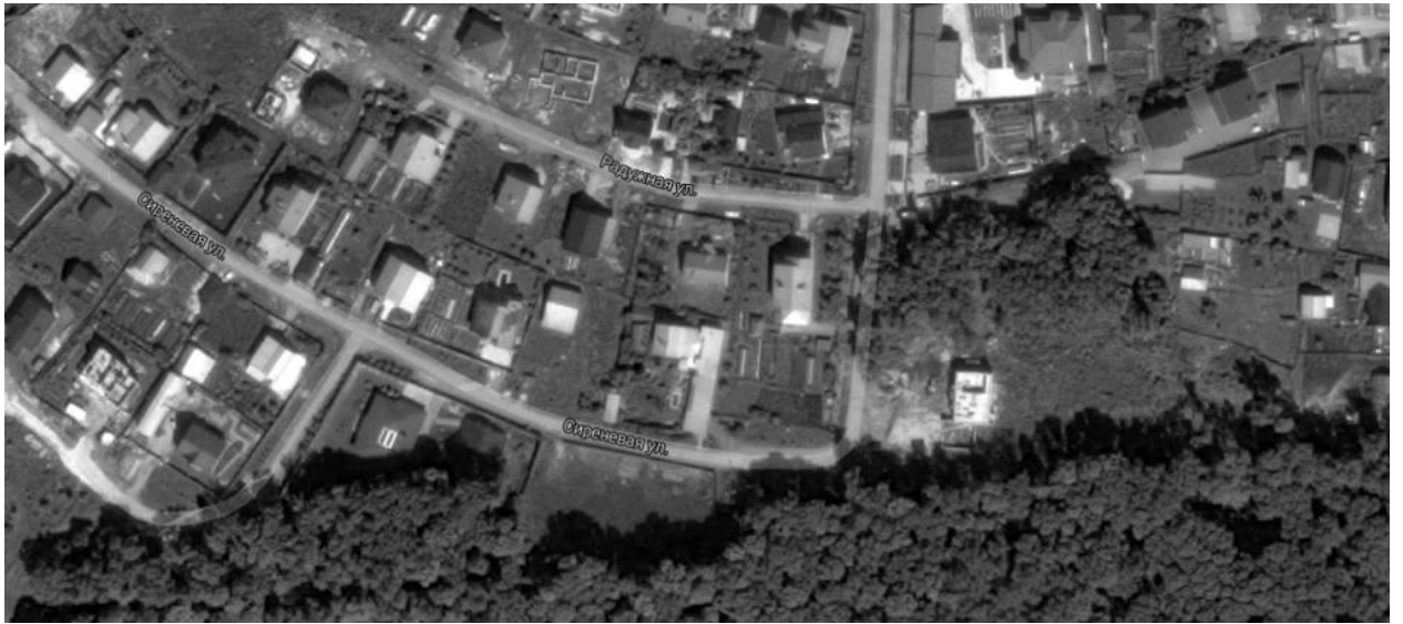
Рис. 1. Квартал Пензы с частью лесного массива.

Ни в одном из исследованных городов, судя по космическим снимкам, даже посчитанные по максимуму кварталы новой застройки не составляют более половины. В Рязани кварталы с одними современными зданиями являются меньшей частью городской застройки. Только в сумме со смешанными кварталами районы современной застройки в трех городах преобладают.