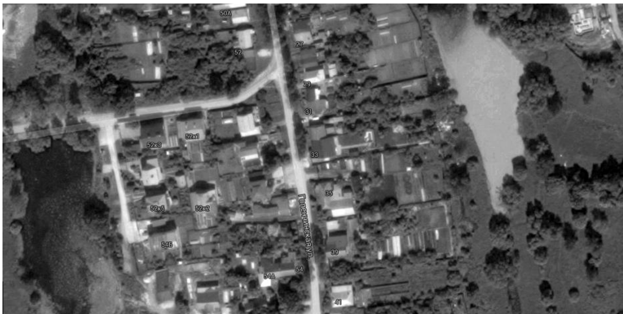
Рис. 3. Кварталы старой застройки в Рязани.

Следует иметь в виду, что значительная часть современной застройки появилась в Пензе, Рязани и Тамбове уже в начале XXI в.