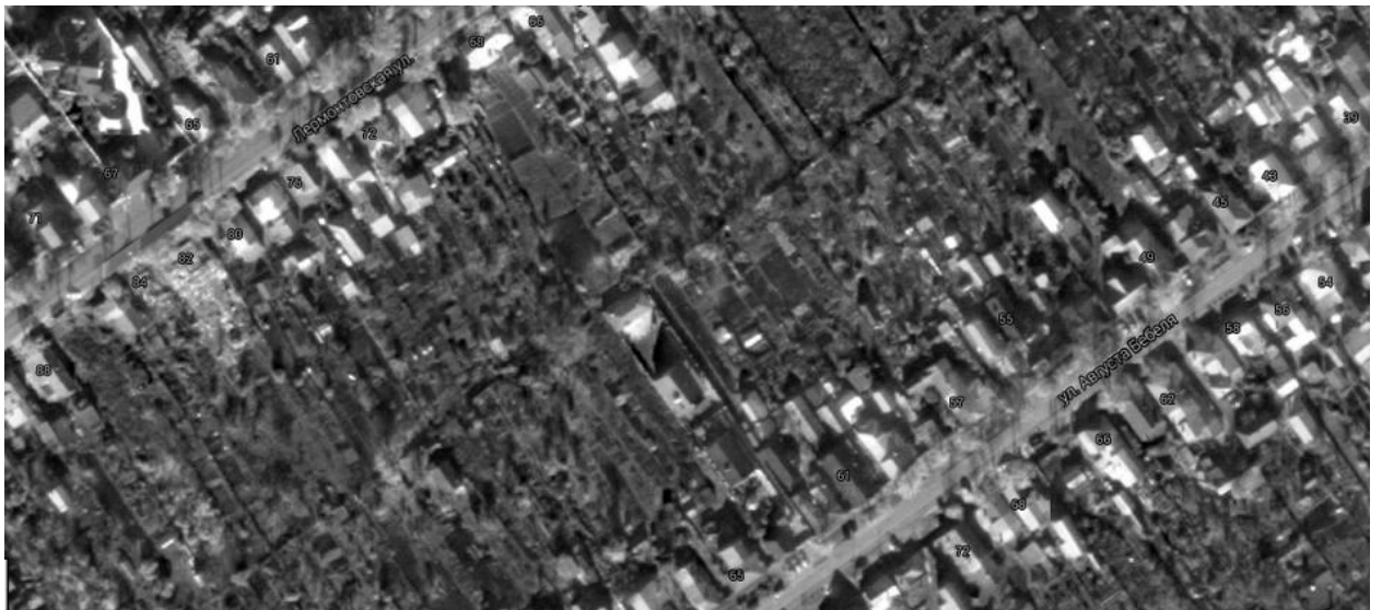
Рис. 5. Массив частных садов в кварталах старой застройки Тамбова, близких к центру города.

На космических снимках 549 кварталов современной Пензы (77% от всех кварталов города) можно увидеть существование частных садов. Соответствующий показатель в Рязани составил 104 квартала (25%), в Тамбове – 132 квартала (62%).