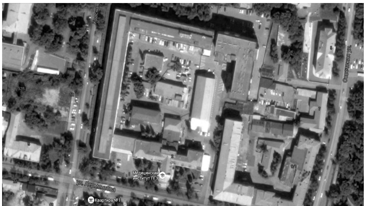
Рис. 2. Кварталы новой застройки в Пензе.

Ни в одном из исследованных городов, судя по космическим снимкам, даже посчитанные по максимуму кварталы новой застройки не составляют более половины. В Рязани кварталы с одними современными зданиями являются меньшей частью городской застройки. Только в сумме со смешанными кварталами районы современной застройки в трех городах преобладают.